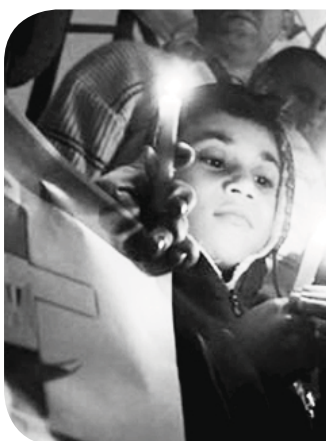
Muslimer beskytter koptiske kristne i Cairo