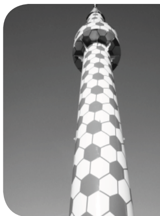
Minaret i Hamborg udsmykket med inspiration fra det lokale fodboldhold. En gruppe danske præster besøgte moskeen i marts 2010

Sekretariatets rammer er nu blevet for små, og på baggrund heraf har bestyrelsen truffet beslutning om at flytte F&R's sekretariat til Diakonissestiftelsen på Frederiksberg. Her kommer F&R pr. 1. maj 2011 til at indgå i et kontorfællesskab med bl.a. Folkekirkens mellemkirkelige Råd, Areopagos, Danske Kirkers Råd, Kirkefondet m.fl.